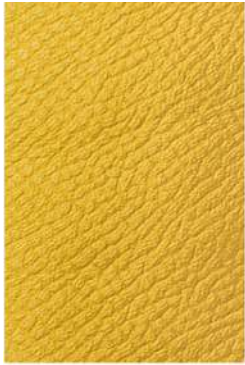
CL ブライトイエロー

カラーサンプルは、モニターの色設定や環境によって、実際の色と異なる場合がございますので、あらかじめご了承ください。