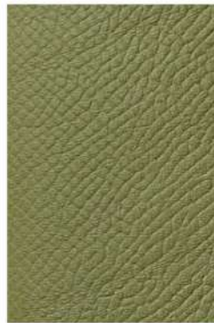
CL フィールドグリーン