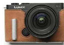
VINクレイジーホース