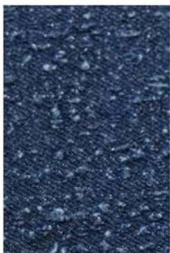
スターリースカイデニム