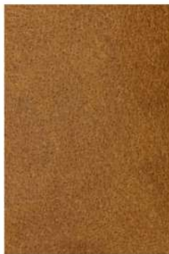
VIN クレイジーホース