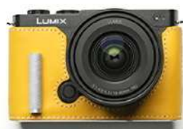
CLブライティエロー