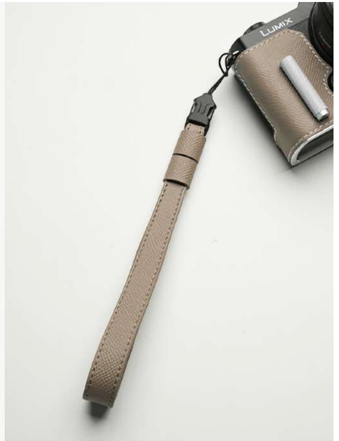
リストストラップ