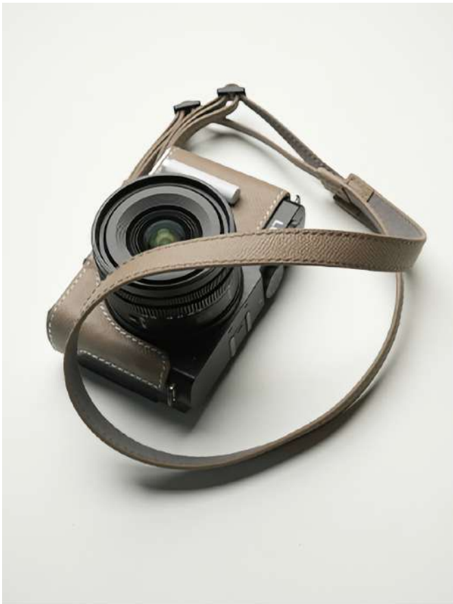
ショルダーストラップ