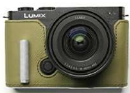
CLフィールドグリーン